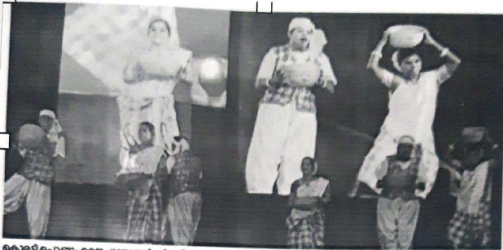
കൊമട്ടി പൊങ്ങം നൈപുണ്യ ഇൻസ്റ്റിറ്റ്യൂട്ട് ഓഫ് ഓറിയന്റൽ ആൻഡ് ഇൻഫർമേഷൻ ടെക്നോളജിയിൽ നടന്ന സ്പോർട്സ്മെന്റുകളിൽ വിനോദകരമായ കട്ടികൾ അവതരിപ്പിച്ചു.